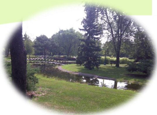
Photo: Parc Wilfrid-Bastien