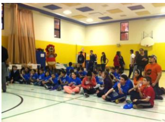
Foire sur la santé regroupant les enfants d'une école francophone et une école anglophone.