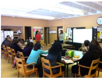
Stagiaire en Diététique à l'Université McGill Dietetics présente un atelier sur les collations saines à l'école primaire Gerald McShane.