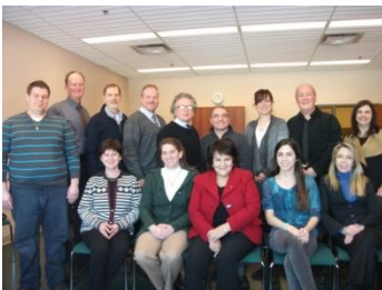
Des membres du RCSSS et de la Table du Réseau communautaire Montréal-Laval-Rive-Sud se rencontrent dans l'Est de l'Île le 23 janvier 2013.